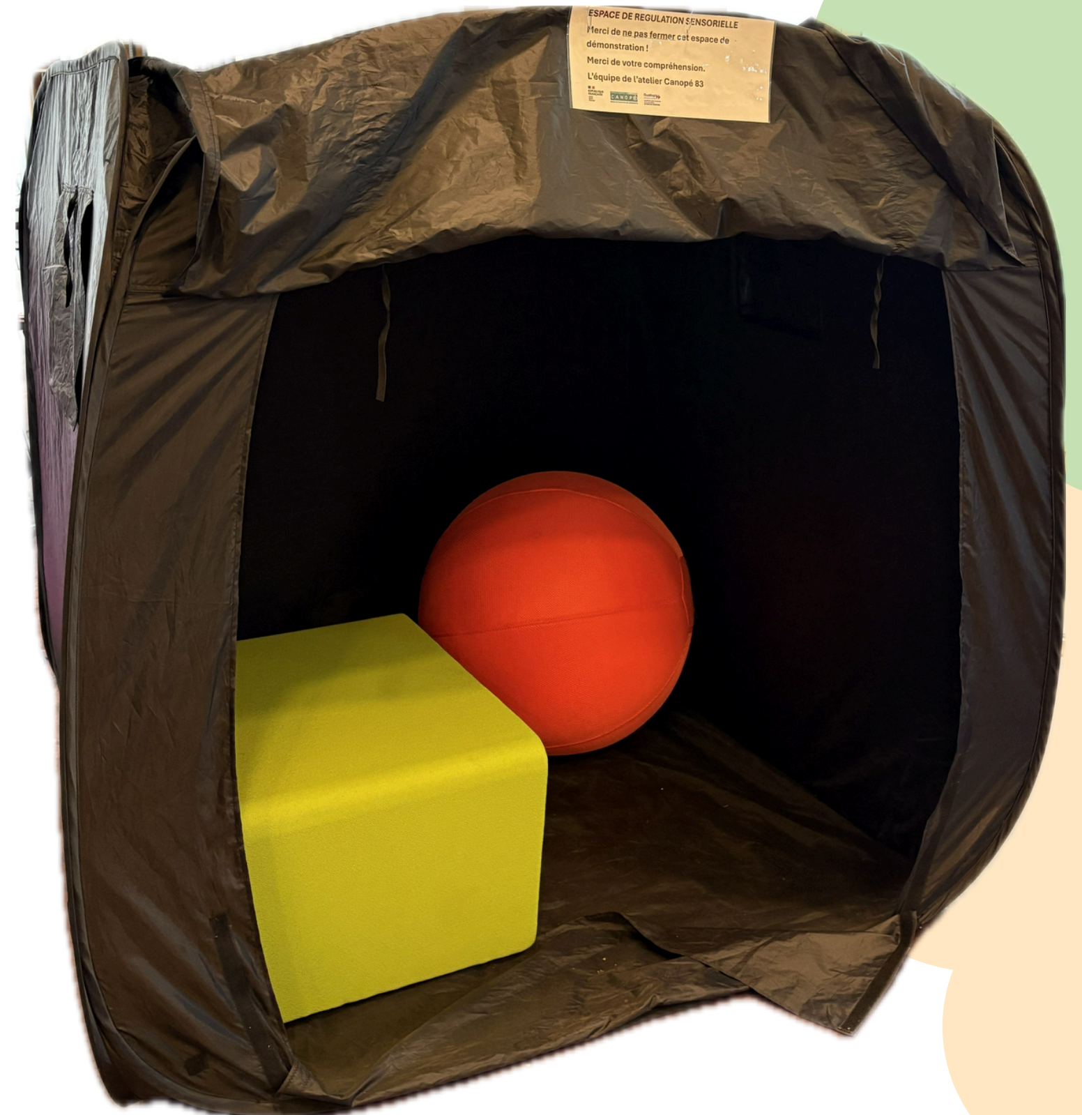
Atelier Canopé 83 - Toulon